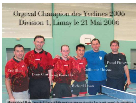
Reconnaissez-vous ces jeunots !