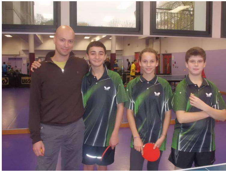
Notre équipe de Cadets et leur coach lors de la 5ème Journée de Championnats Départementaux Jeunes (de gauche à droite):