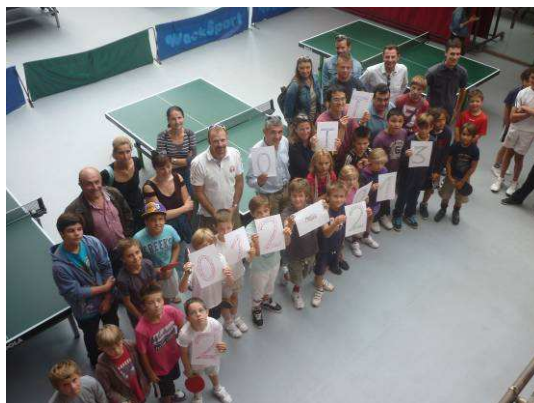
Les jeunes joueuses et joueurs du club OTT et leurs parents

les mercredis et samedis après-midi au gymnase du Plateau Saint-Marc